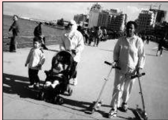
La promenade du dimanche à Beyrouth. La présence des domestiques permet aux employeurs d'afficher leur richesse.