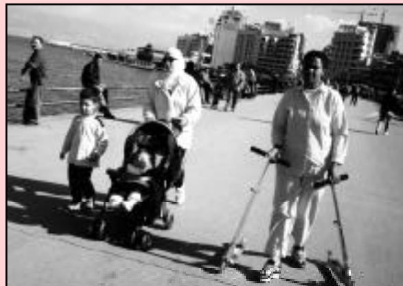
La promenade du dimanche à Beyrouth. La présence des domestiques permet aux employeurs d'afficher leur richesse.