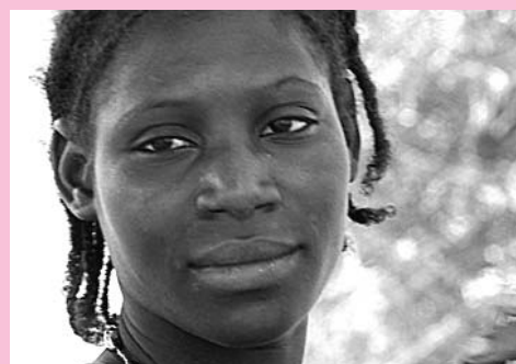
Le regard d'Iguimat

Il braque ses projecteurs sur les actions menées par notre partenaire.